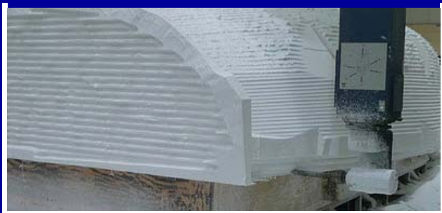
LA MAQUINA QUE MOLDEA EL POLIURETANO EXPANDIDO, PARA DAR FORMA AL MOLDE DEL CASCO.